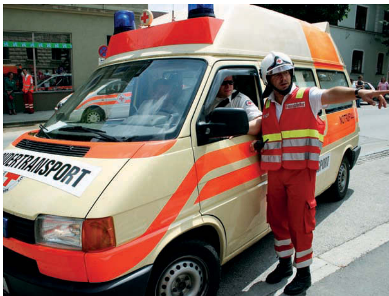
Abb. 2: Sonderregelung für Lenkberechtigung auch für Rettungsorganisationen